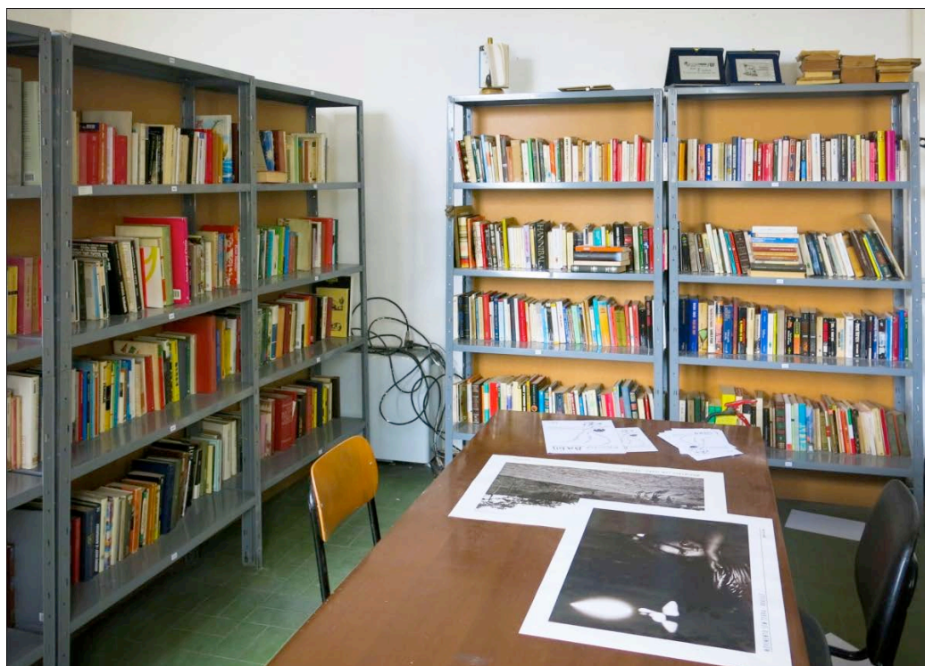
Figura 5. La biblioteca