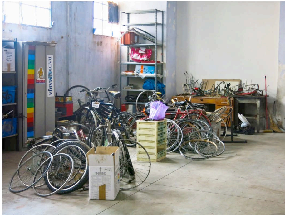
Figura 6. La ciclofficina