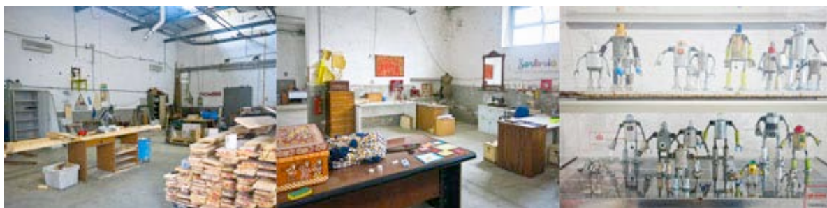
Figura 4. I laboratori