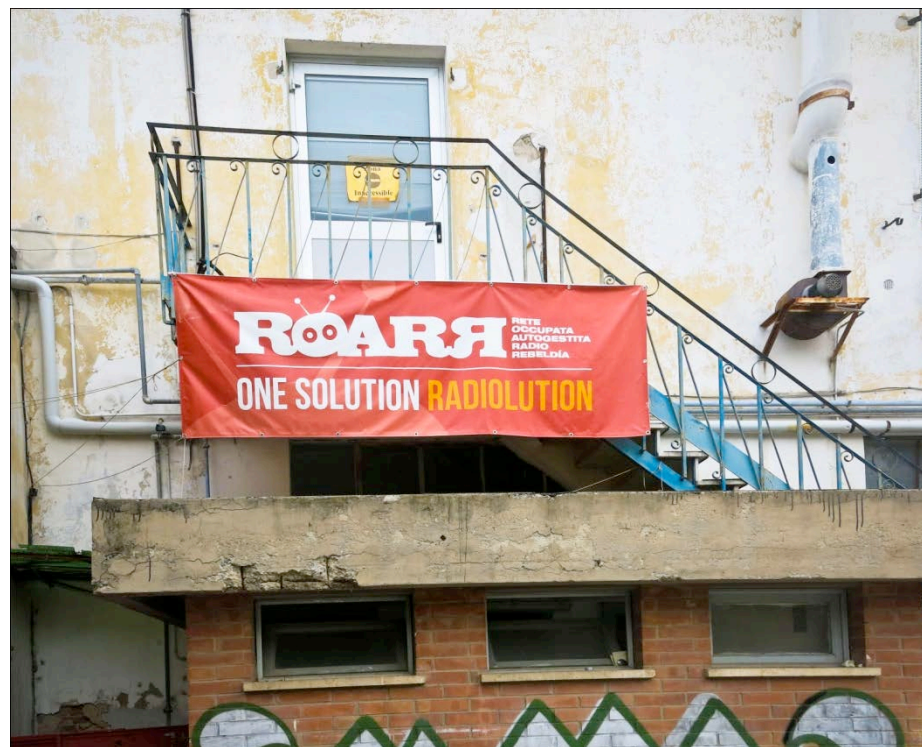
Figura 2. La radio