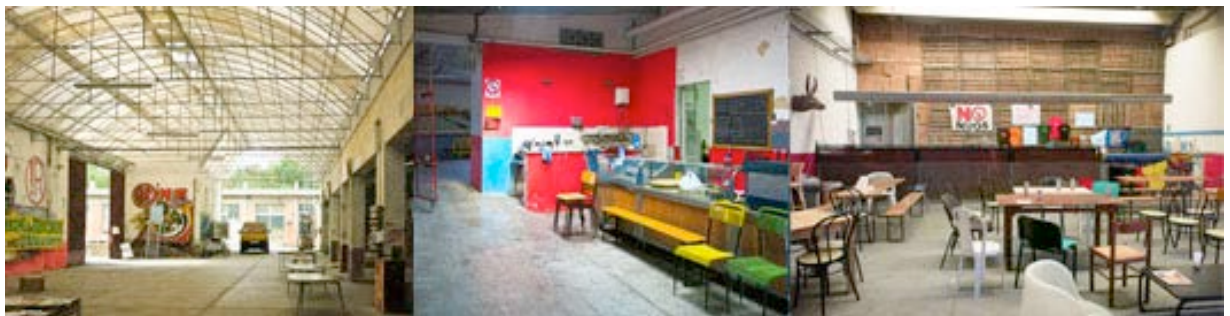
Figura 8. Spazi comuni