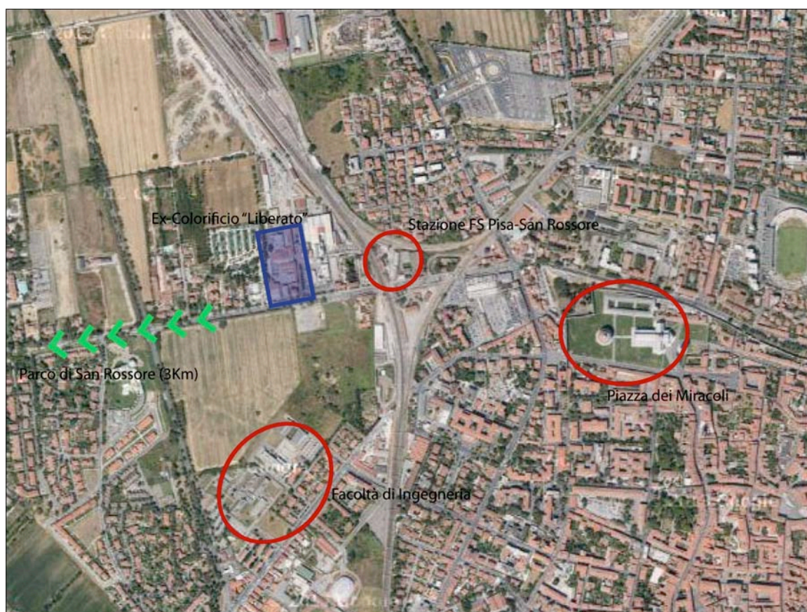
Figura 1. Localizzazione Ex.Colorificio. La vicinanza della struttura ad alcuni 'poli' urbani fondamentali della città rende l'area particolarmente 'appetibile' da un punto di vista urbanistico, soprattutto in relazione a nuove operazioni legate al mercato immobiliare.