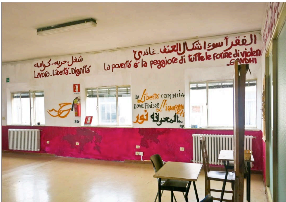
Figura 7. La scuola di arabo